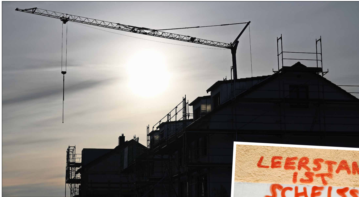
Zwei Bilder, zwei Wahrheiten: Bauen schafft (bezahlbaren) Wohnraum – und das andere ist selbsterklärend.

Neben den großen hat die Stadt in den vergangenen fünf Jahren viele kleinere Projekte vorangetrieben. Manche sind noch in der Planung, andere schon im Bau, viele sogar schon fertiggestellt. Fast immer ist dabei die städtische Tochtergesellschaft Freiburger Stadtbau (FSB) mit im Boot, beispielsweise in Haslach im Quartier Uffhauser Straße und am Schildackerweg, im Mooswald am Elefantenberg und in