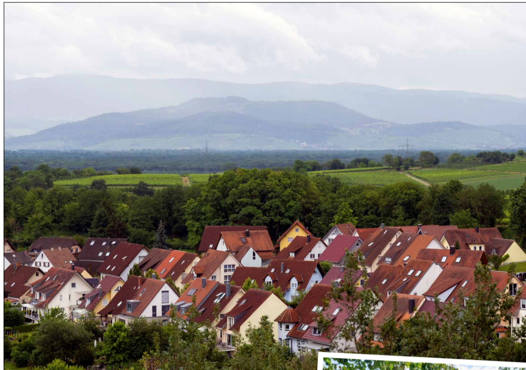
Große Pläne: 240 Wohnungen sollen im Neubaugebiet Niedermatten entstehen. Frisch gemacht wird zudem das Areal rund um die Steinriedhalle (Bild rechts).

Zunächst aber brachte OB Horn das hohe Engagement der Waltershofer Freiwilligen Feuerwehr zur Sprache. Bei dem Brand im Industriegebiet Hochdorf Anfang Oktober waren es auch ihre Mitglieder, die kräftig mit anpackten – bis in die frühen Morgenstunden: „Bis um 4.30 Uhr waren 14