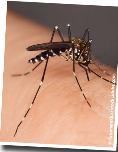
Zur Reinigung am besten eine harte Bürste oder einen

Nun sind nur noch vereinzelt Tiere unterwegs, doch nach der Tigermückensaison ist vor der Tigermückensaison. Im Herbst legen die verbliebenen Mücken noch Eier ab, diese überwintern und schlüpfen, wenn es ab Mitte April wieder wärmer wird. Deshalb ist es wichtig, im Garten, auf der Terrasse und auf dem Balkon klar Schiff zu machen: Nicht mehr benötigte Gefäße, Behälter und Untersetzer sollten geleert, gründlich gereinigt und über den Winter trocken gelagert werden.