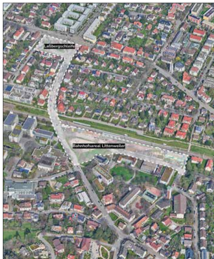
Viel Entwicklungspotenzial gibt es an der Laßbergschleife und dem benachbarten Bahnhof Littenweiler.

Mit einer Machbarkeitsstudie möchte die Stadtverwaltung eine gute städtebauliche Konzeption für die neue Mitte finden. In zwei Stufen sollen Bebauungsvarianten mit alter-