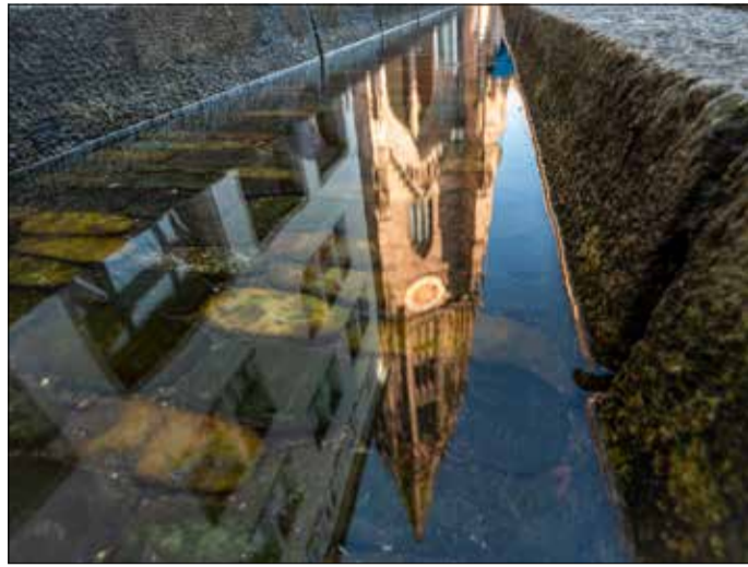
Einem Perspektivenwechsel erlaubt der Erlebnistag „Tourist in der eigenen Stadt“ am 18. Mai.

Neben klassischen und thematischen Stadtführungen gibt es auch Schauspiel- und Weinführungen und eine Tour durch das Europapark-Stadion. Blicke hinter die Kulissen erlauben das Stadttheater, das