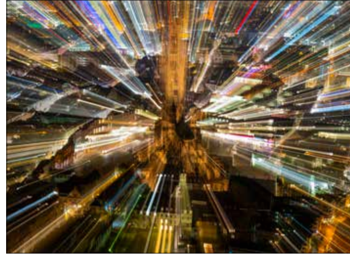
Viele Faktoren haben Einfluss auf den Immobilienmarkt.